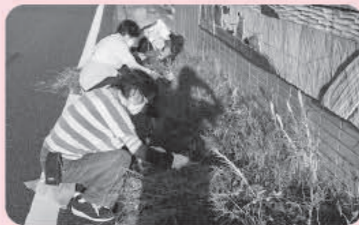
美化の日 シンボルロードの草引きも行いました