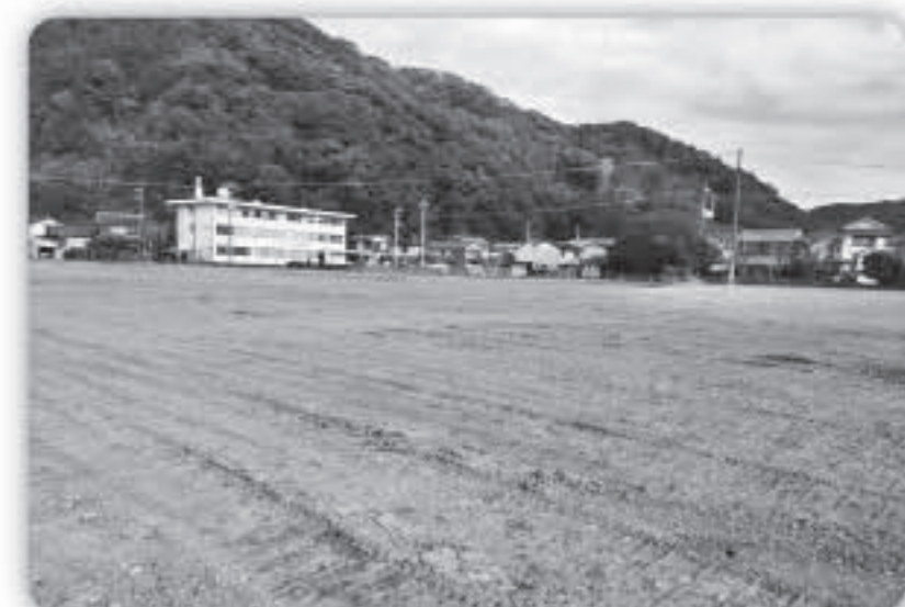
更地となった旧会館跡地

昨年は古市町通りに須崎サカナ本舗が誕生し町の様子に変化がありました。会議所跡地である西糺町に図書館等の複合施設が誕生するのが令和8年度予定とのこと。市民の憩いのエリアとして生まれ変わることを楽しみにしています。