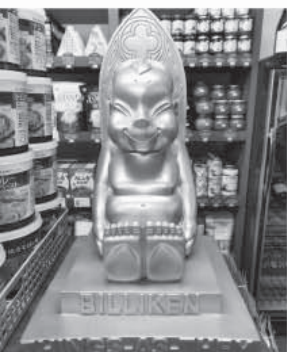
リニューアルしたふるや酒店 P6にて紹介