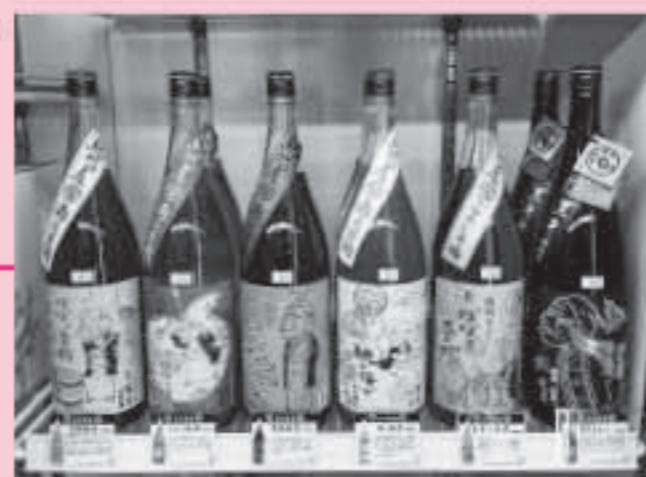
サカヤノツマミグラで人気の種類豊富な梅酒も取り揃えています!