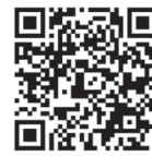
小企業の経営指標調査